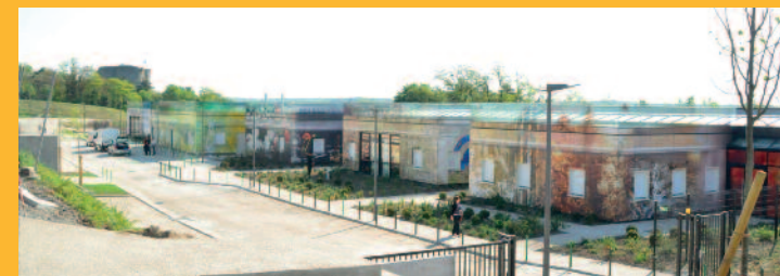
Maison de la petite enfance à Étampes © cabinet d'architecture Orbach-Coste

Le nouveau centre multi-accueil pour l'enfance, situé à Étampes, est un