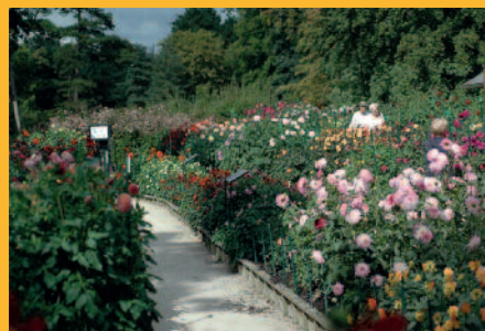
La collection des dahlias du Parc Floral de Paris

végétales, dont de nombreuses variétés de dahlias qui fleurissent de juillet aux premières gelées. Le Parc floral organise chaque année le concours international du dahlia, qui met en compétition une centaine de variétés inédites ou récemment commercialisées venant du monde entier. Venez découvrir les variétés de dahlias en compagnie de son responsable, Dominique Fougerouse.