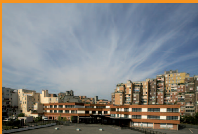
Le collège des Pyramides

En partenariat avec la ville d'Évry MÉMOIRE D'UNE UTOPIE : LES PYRAMIDES (1975-2015)