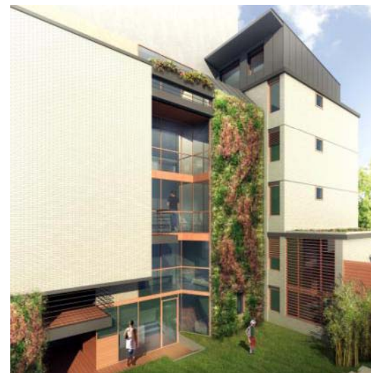
Vue du jardin intérieur

Entreprise lots bois: SAS POULINGUE (27) (structure bois, menuiseries, couvertures, façades)