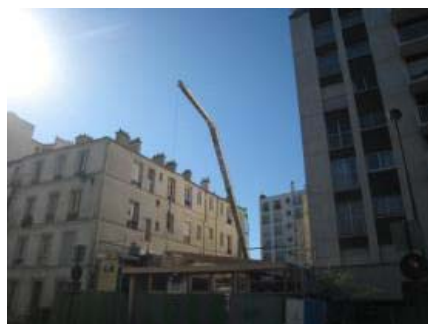
Vue de la rue Carducci